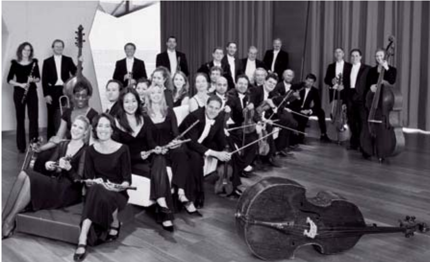
Die Camerata Salzburg spielt bei den Finaldurchgängen der Sparte Klavier und Violine.

Das Ensemble wurde 1952 von Bernhard Paumgartner gegründet. Der legendäre Geiger Sándor Végh prägte von 1978 bis zu seinem Tod 1997 die stilistische Identität der Camerata Salzburg. Es folgte Sir Roger Norrington, der von 1997 bis 2006 Chefdirigent der Camerata Salzburg war. Ab der Saison 2007/08 bis September 2009 nahm Leonidas Kavakos die Position des Artistic Director der Camerata Salzburg ein. Sir Roger Norrington ist dem Orchester als Ehren-dirigent verbunden.